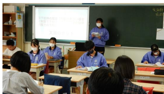
校則検討委員会での協議の様子